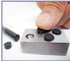
②穴にオイルスティックを埋め込みます