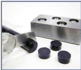
①オイルスティックを穴の深さより少し長めにカットします

規格品の無給油プレートのサイズが、御社の仕様に合わなかった事はございませんか？ また、自社で作製した部品を無給油化したいと思った事はございませんか？ 埋込式固形潤滑剤のオイルスティックは誰でも 簡単に無給油摺動部品を製作できます 。切って埋設して仕上げるだけで無給油部品の出来上がりです。 スタンダードタイプ/高温タイプ/食品機械対応タイプ の3種類から選択可能です。ベースオイルの含有率なども変更可能です。